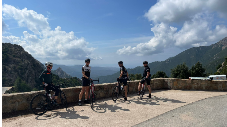
Jour 3 - Saint Florent - Calvi