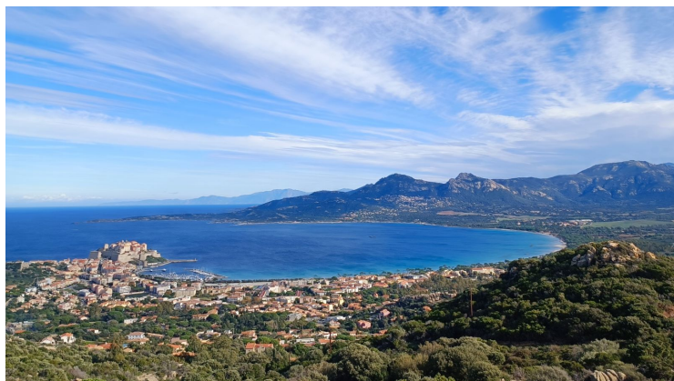
Jour 4 - Calvi - Porto